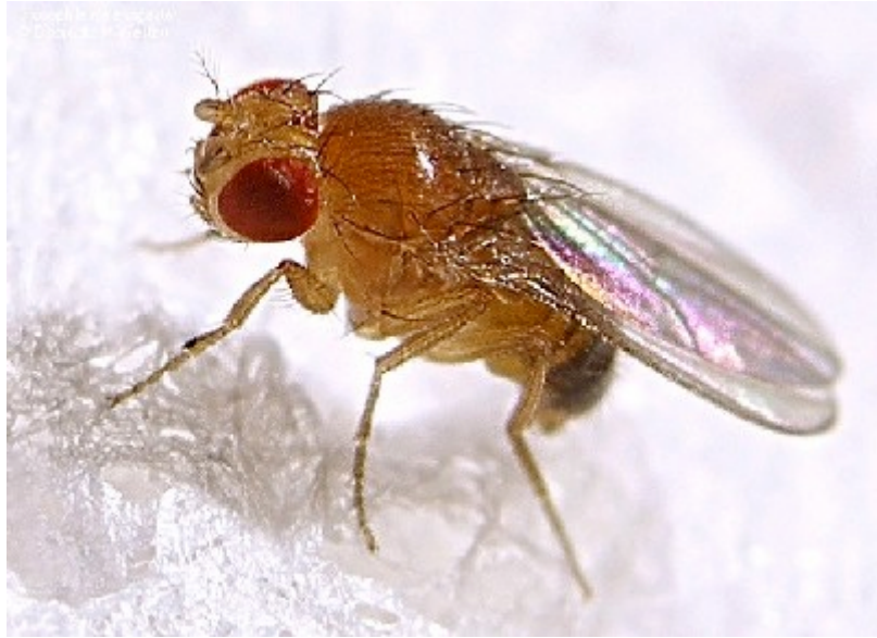
Figura 5.- Color de ojos: cepa Henna