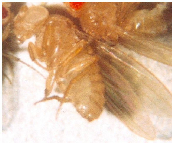
Figura 4.– Color de ojos: cepa white

Entre el enorme número de mutantes de ojos de Drosophila melanogaster , cabe destacar el mutante recesivo white , de color de ojos blanco (Figura 4) por la ausencia de ambos pigmentos, y el mutante recesivo Henna , de color de ojos marrón oscuro (Figura 5), por la ausencia de pigmentos rojos.