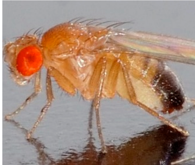
Figura 3.– Color de ojos: cepa salvaje (wild)

los ojos del individuo salvaje ( wild ) es rojo (Figura 3) debido a la interacción entre los dos tipos de pigmentos que poseen: omocromos, o pigmentos marrones, y pteridinas o pigmentos rojos y amarillos.